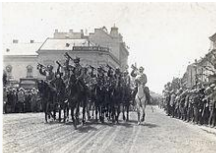
Intrarea Regimentului 16 Dorobanți „Fălticeni” în Cluj, 1918

Ziua națională a României a fost între 1866-1947 ziua de 10 mai , apoi, între 1948-1989 , ziua de 23 august . Prin legea nr. 10 din 31 iulie 1990 , promulgată de președintele Ion Iliescu și publicată în Monitorul Oficial nr. 95 din 1 august 1990 , ziua de 1 decembrie a fost adoptată ca zi națională și sărbătoare publică în România . Această prevedere a fost reluată de Constitutia României din 1991 , articolul 12, alineatul 2. Opoziția anticomunistă din România a pledat în 1990 pentru adoptarea zilei de 22 decembrie drept sărbătoare națională, fapt consemnat în stenogramele dezbaterilor parlamentare.