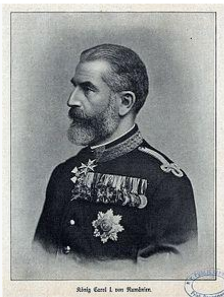
Carol I al României

Ziua națională a României a fost între 1866-1947 ziua de 10 mai , apoi, între 1948-1989 , ziua de 23 august . Prin legea nr. 10 din 31 iulie 1990 , promulgată de președintele Ion Iliescu și publicată în Monitorul Oficial nr. 95 din 1 august 1990 , ziua de 1 decembrie a fost adoptată ca zi națională și sărbătoare publică în România . Această prevedere a fost reluată de Constitutia României din 1991 , articolul 12, alineatul 2. Opoziția anticomunistă din România a pledat în 1990 pentru adoptarea zilei de 22 decembrie drept sărbătoare națională, fapt consemnat în stenogramele dezbaterilor parlamentare.