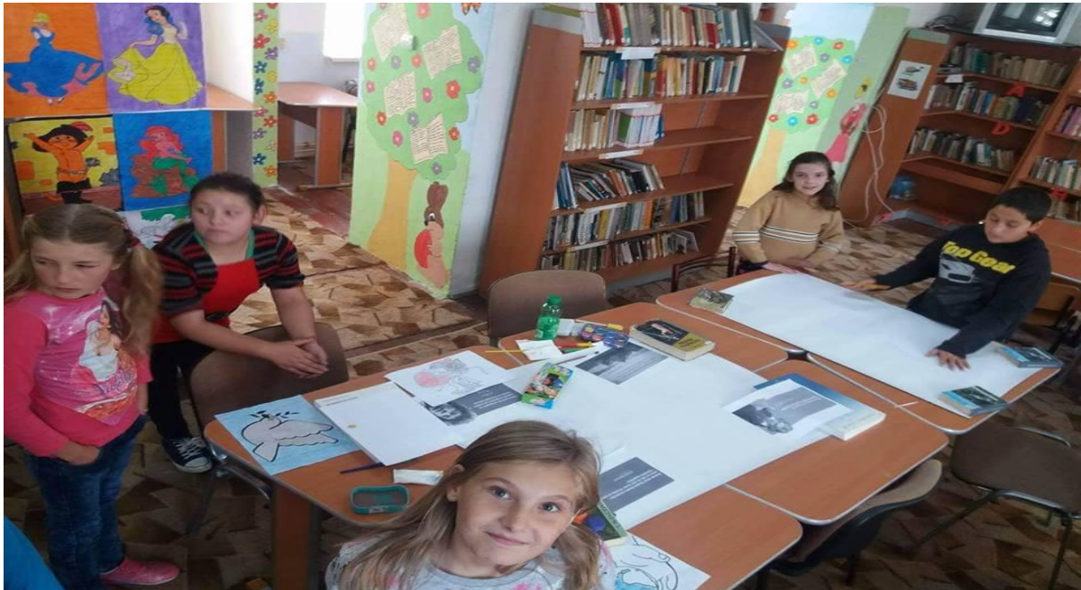
FOTO CLUB REALIZAT DE OGLAVIE ANDREEA –CLASA A VII A POZELE DE LA ACTIVITĂȚILE DIN CDI LUPȘA SUNT EXPUSE PE PAGINA DE FACEBOOK –CDI LUPȘA-URMĂRIȚINE !