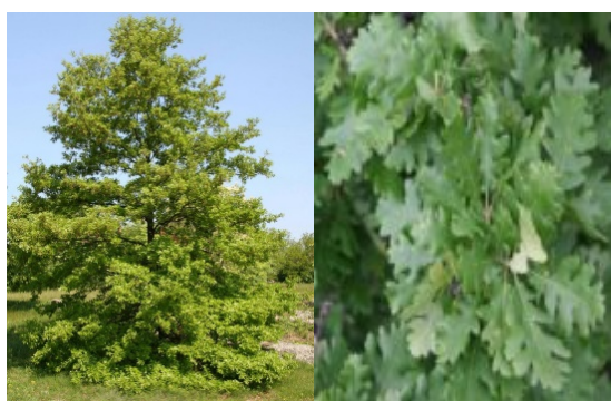
Stejar pufos frunze

https://silvanews.ro/silvicultura/dendrologie/stejar-pufos-stejarica/