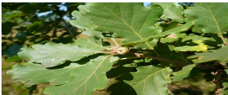
Foto: Quercus pubescens (stejarul pufos) ( http://www.google.ro/imghp )

Pădurea Crivineni a fost declarată arie protejată prin Legea Nr.5 din 6 martie 2000 (privind aprobarea Planului de amenajare a teritoriului național - Secțiunea a III-a - zone protejate). https://ro.wikipedia.org/wiki/P%C4%83durea_Crivineni